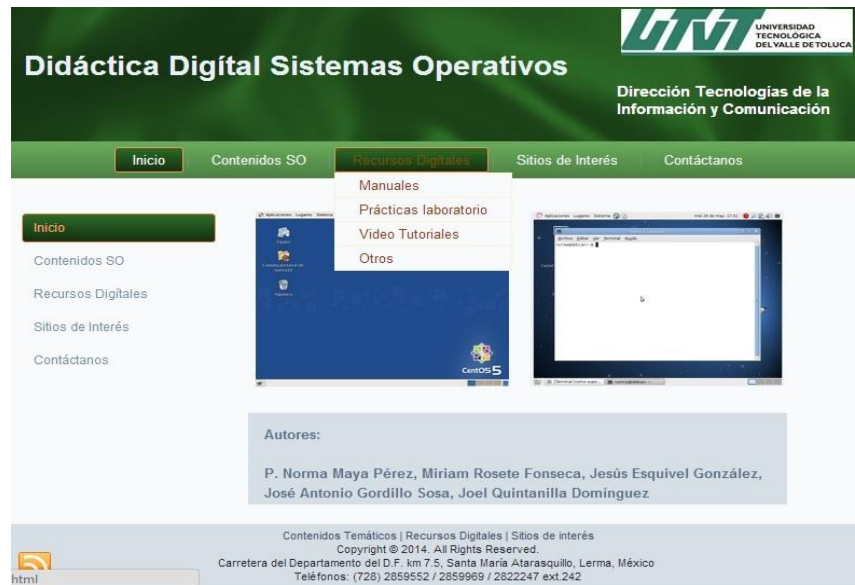
Figura 12.3 Interfaz de prácticas de DidDSO