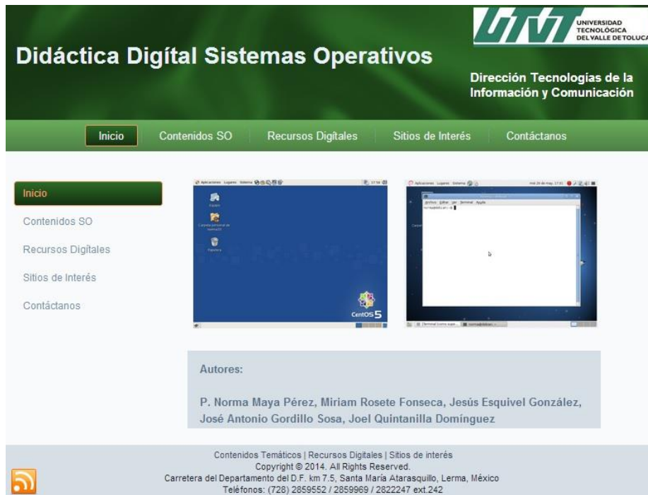
Figura 12 Interfaz principal de DidDSO

En la sección de contenidos podemos revisar el marco teórico referente a Fundamentos de los sistemas operativos, entorno de trabajo de sistemas operativos Windows y Linux, cuya finalidad es que el estudiante comprenda y analice conceptos básicos de: ¿qué es un sistema operativo?, ¿cuáles son sus características y componentes que lo integran?, ¿cómo han evolucionado?, así como la clasificación de acuerdo a la aplicación para el equipo de cómputo destinado. (ver figura 12.1).