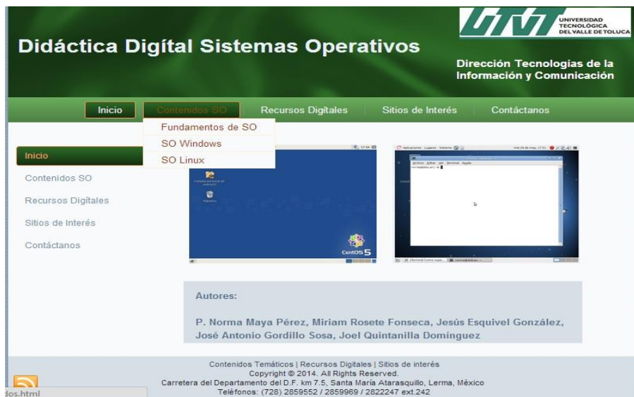
Figura 12.1 Interfaz de contenidos temáticos de DidDSO

La sección de Recursos digitales integra diversas didácticas como (ver figura 12.2): manual de asignatura que incluye todos los contenidos temáticos del curso, prácticas de laboratorio