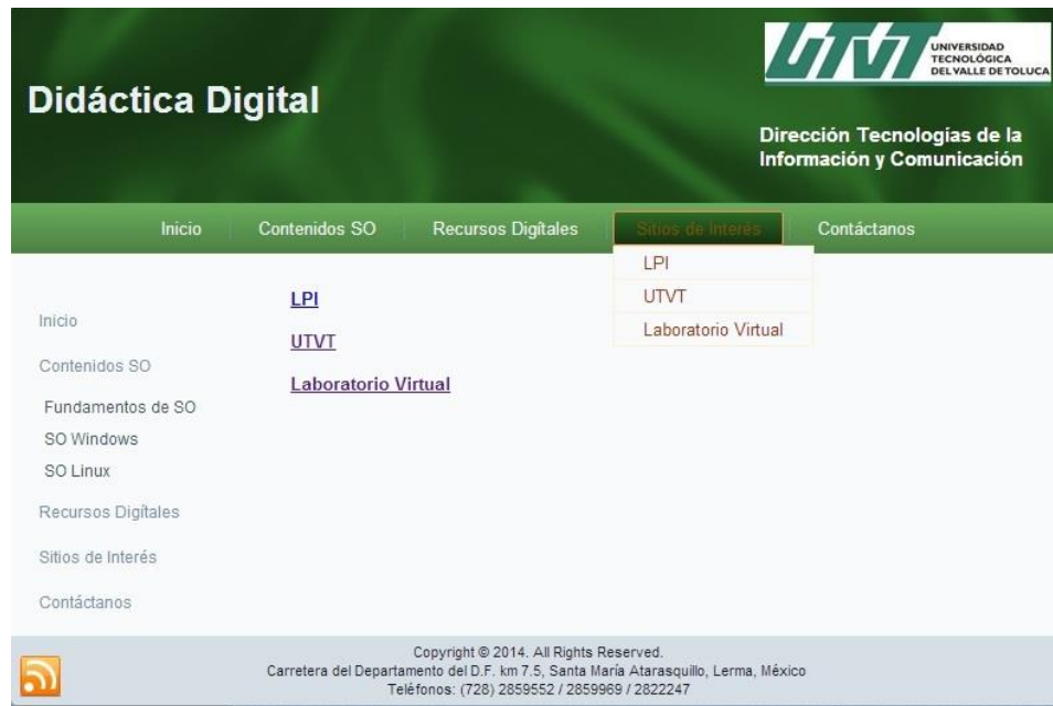
Figura 12.6 Interfaz Contacto de DidDSO